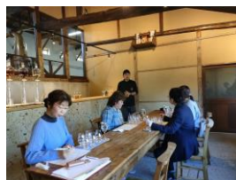
【自分だけのウイスキー作り体験】

アジア系旅行会社・ランドオペレーターより「団体に対応できる工夫を」「ペアリングで楽しめる軽食をセットできないか」等の改善意見を頂きました。