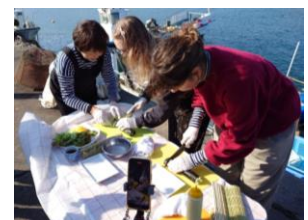
【手巻き寿司体験（八戸市）】