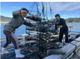
【牡蠣棚 視察の様子】

陸前高田の生産者や高品質な食材が育まれる風土をめぐりながら、一流の料理人の手で考案された特別メニューを堪能するコンテンツの商品化を目指し、現地視察を行いました。参加した欧米向け旅行会社から「ガイドの知識が豊富で理解が深まる」「牡蠣棚を見学した後に牡蠣を食べるなど体験的な要素があると尚いい」「生産者ともっと直接話ができれば」等のご意見をいただきました。