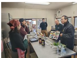
【喜多方ラーメンづくり体験】

欧米系旅行会社とのディスカッションでは「麺づくりからできると尚良い」「煮込み待ち時間に、竹細工体験と組み合わせも」等のご意見も頂きました。