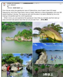
【6/26投稿 松島湾でのSUP体験】 (宮城県宮城郡松島町)