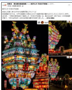
【7/1投稿 能代七夕 天空の不夜城】 (秋田県能代市)