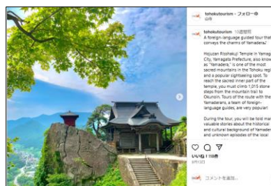
【9/13投稿 ヤマデラズ～山寺 奥の院を巡るガイドツアー～】 (山形県山形市)