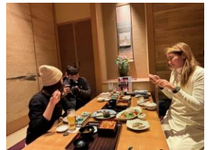
【旬のはらこ飯の取材】