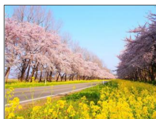
【4/1投稿 大湯村 桜・菜の花ロード】 (秋田県南秋田郡大湯村)