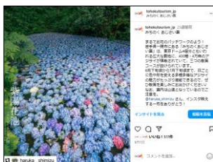
【6/1投稿 みちのくあじさい園】 (岩手県一関市)