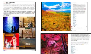
【ドライブルートに関する投稿】 【季節のコンテンツ】