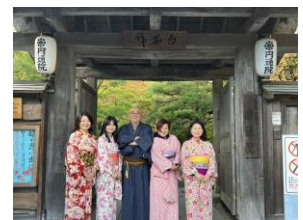
【円通院で記念撮影】