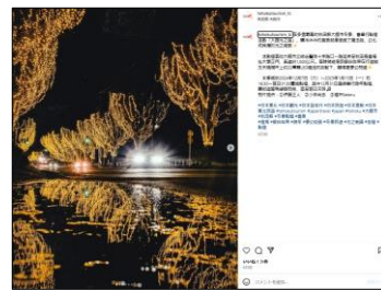
【大館シャイニングストリート（秋田県）】