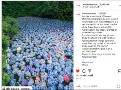
【6/1投稿 みちのくあじさい園 (岩手県一関市)