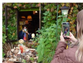
【地元で人気の喫茶店（盛岡市）】