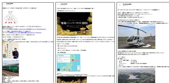
【TOHOKU Fan Clubによるイベントの紹介】