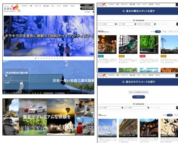
【旅東北ホームページ】

また、旅東北に掲載しているコンテンツから、特集記事の作成やSNSへの投稿も行い、幅広いユーザーへの接触機会の向上を図るなど、東観推のメディアによる一体的なプロモーションに取り組んでいます。