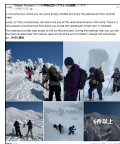
【「手ぶらで」八甲田樹氷スノーシューツアー（青森県）】