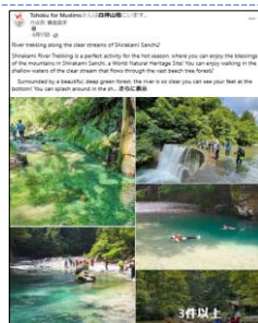
【6/17投稿 白神リポートレッキング】 (秋田県山本郡藤里町)