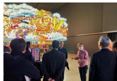
【ねぶたの家ワ・ラッセ見学の様子】

参加した先生方からは、「地域によってお祭りの主体やお囃子等が異なり、見どころ(学びどころ)満載の魅力あふれる学習地だと感じた」「教育旅行への熱意に溢れ、人の温かみも感じた。生徒にとって思い出深い学習になるだろう」など、高い評価をいただきました。