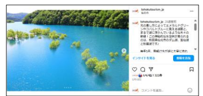
【5/10投稿 玉川の水没林】 (秋田県仙北市)