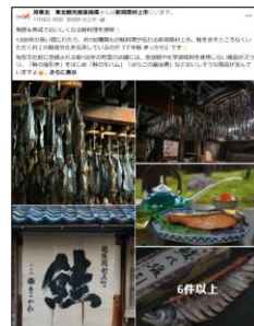
【千年鮭 きっかわ（新潟県）】