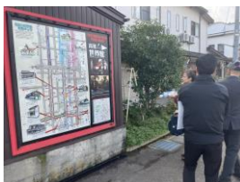
【映画館・城下町歩き体験】

日本最古級の映画館、古くから残る呉服店や街並み、料亭でのお食事を組み合わせた唯一無二のコンテンツ造成に向けて視察・検討会を実施しました。映画館は空間として非常に魅力的で、軽食とドリンクをセットにした「シアターバー」へのグレードアップ、リクエストベースでの映画上映会、ガストロノミーツアー等、様々なアイデア出しが行われました。