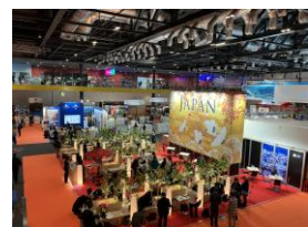
【ジャパンプースの様子】

商談相手のほとんどが訪東北商品未造成の旅行会社で、ゴールデンルート以外の目的地を探しており、JRバスを活用した広域周遊プランやみちのく潮風トレイル等のコンテンツを案内することで、商品造成へ向けより具体的なイメージを掴んでいただくことができました。欧米旅行会社は複数年かけて新規商品造成に取り組むため、引き続きフォローとプロモーションを実施してまいります。