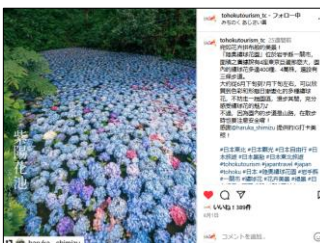
【6/1投稿 みちのくあじさい園】 (岩手県一関市)