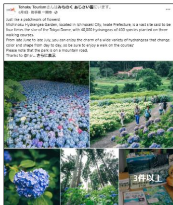
【6/1投稿 みちのくあじさい園】 (岩手県一関市)