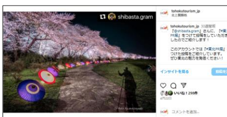
【4/22投稿 北上展勝地さくらまつり】 (岩手県北上市)