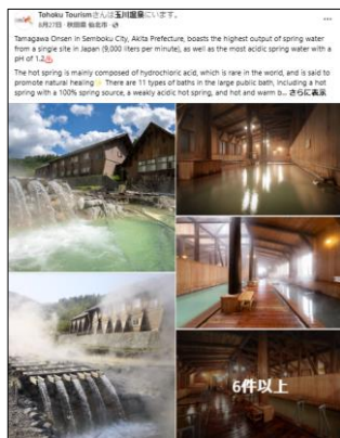
【8/27投稿 玉川温泉】 (秋田県仙北市)