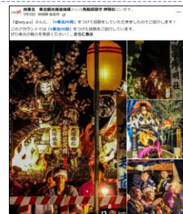
【9/18投稿 角館のお祭り】 (秋田県仙北市)