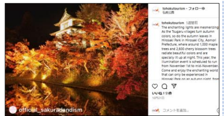
【10/21投稿 弘前城 菊と紅葉まつり ライトアップ】 (青森県弘前市)