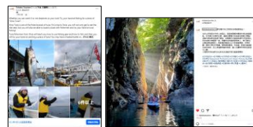
【プレミアムコンテンツに係る投稿】

このほか、海外サポートデスク等と連携し、Weibo（中国）及びFacebook（タイ）でも情報発信を行っています。