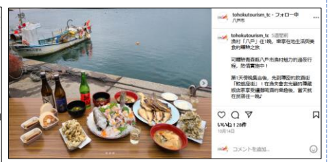
【10/14投稿 漁師のもてなしランチと 八戸横丁・朝市満喫ツアー】 (青森県八戸市)