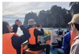
【サッパ船 視察の様子】

岩手・三陸でアドベンチャー体験ができるコースを商品化するにあたり、断崖絶壁を海から臨む「サッパ船」や、手掘りのトンネルを巡る「みちのく潮風トレイル」などを視察するコンテンツ体験会を実施しました。参加した旅行会社・ランドオペレーターより、「地元の方とのふれあいが多くて良い」「悪天候時の代替案の整備が必要では」「現地ガイドと通訳が事前に打ち合わせをする時間も必要」等のご意見をいただきました。