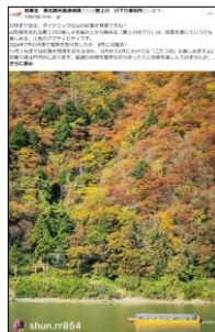
【10/31投稿 最上川舟下り】 (山形県最上郡)