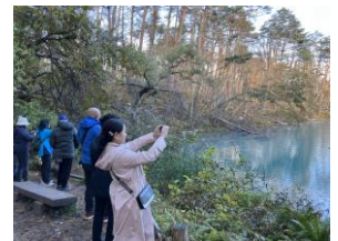
【五色沼散策の様子】