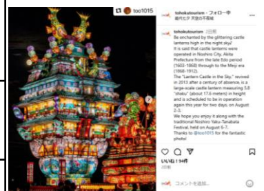
【能代七夕 天空の不夜城】