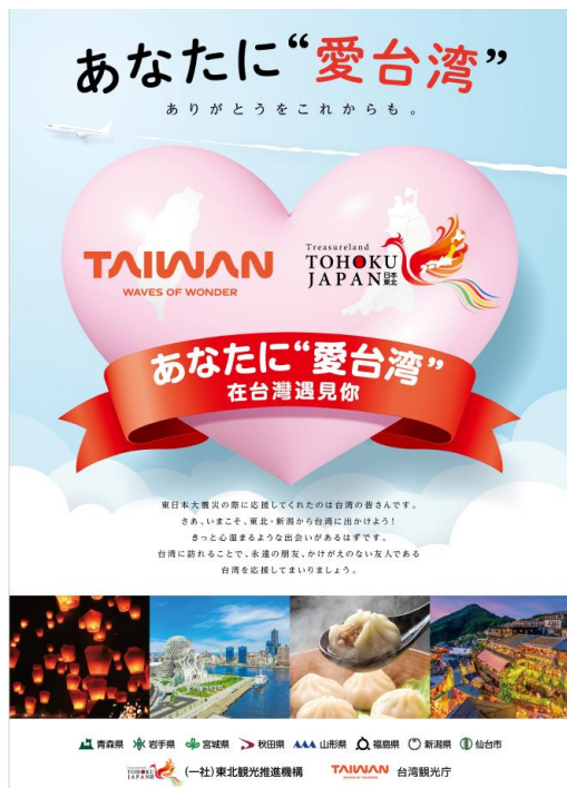
【キャンペーンポスター】