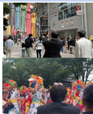
【絆まつり観覧の様子】

また、今後のタイと東北の連携に向けて、TATと関係機関による活発な意見交換も行われました。今後も機会を捉えてTATとの連携による相互交流の促進を図ってまいります。