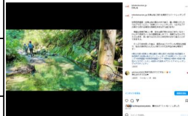
【白神リポートレッキング】