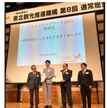
【フェニックスアワード表彰】