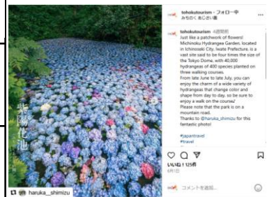
【みちのくあじさい園】