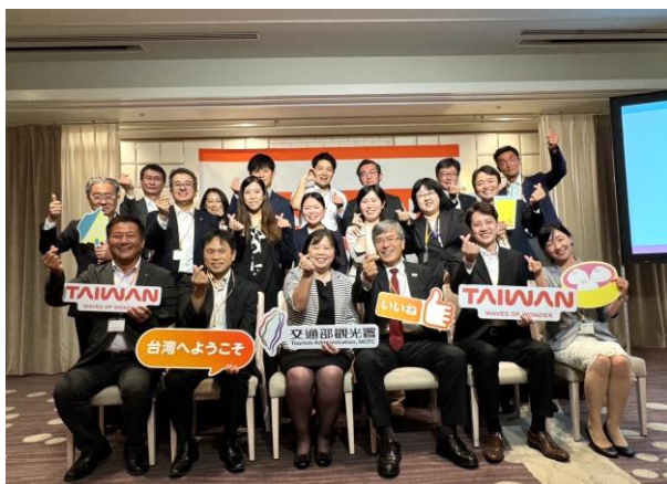
【セミナー後の記念撮影】