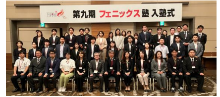
【入塾式に臨む第九期生】

フェニックス塾は、今年度も東北6県と新潟で開催するセミナーとワークショップを通し、オール東北の観点から東北の観光振興策を企画・立案する構想力と行動力を持った人材育成のための活動を実施してまいります。