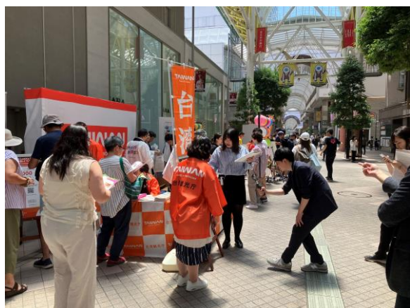
【ビビビビ⚡台湾in仙台】

東観推では、今後とも、東北・新潟の各県はじめ地域のみならずと一丸となり、台湾と東北・新潟との双方向の交流拡大に努めてまいります。